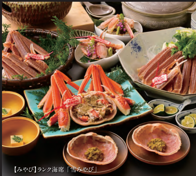
【みやび】ランク海席「雪みやび」