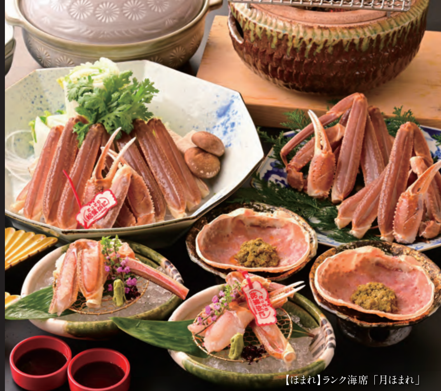
【ほまれ】ランク海席「月ほまれ」

※写真はイメージです。 ※お料理はお二人様よりご用意致します。 ※価格は料金表でご確認ください。